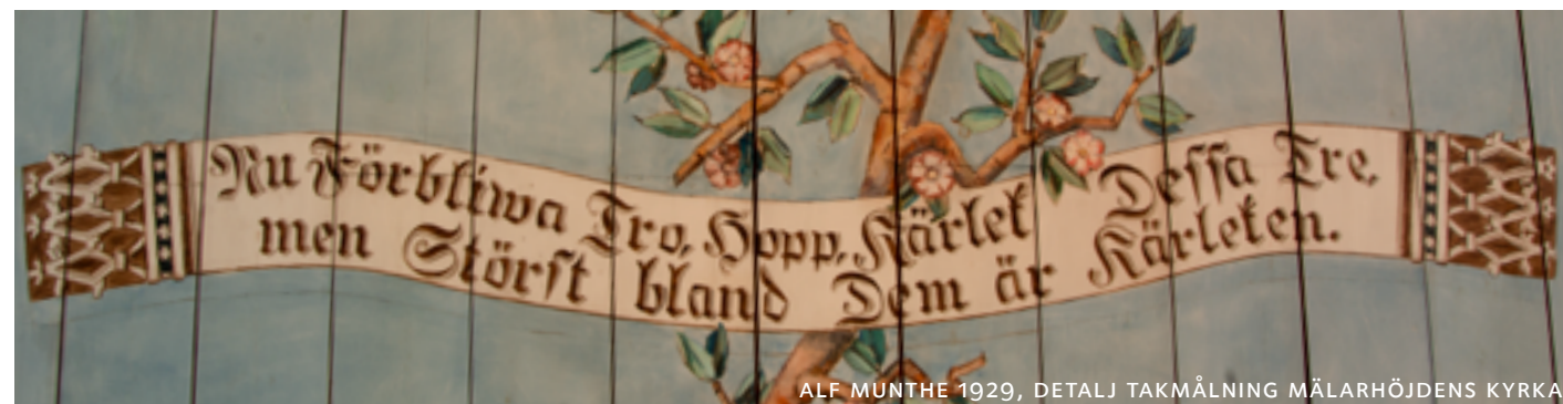
ALF MUNTHE 1929, DETALJ TAKMÅLNING MÄLARHÖJDENS KYRKA